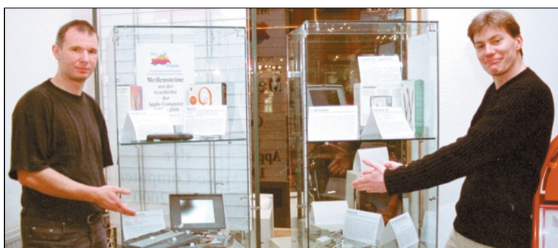
Ein Blick in die Technik-Geschichte: MacPomm zeigt historische Apple-Rechner in der Rostocker Stadtbibliothek.