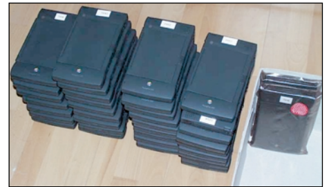
Versandbereit: Newton aus dem Deal.

23.11.1999: Die Besichtigung bestätigt, daß die Newtons in einem hervorragenden Zustand sind. Aber